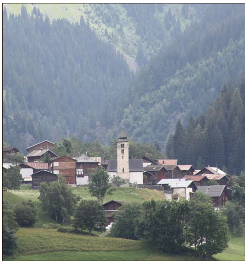
Alla vischnaunca dad Ilanz/Glion eis ei reussiu da presentar in meglier quen visavi al preventiv. Alla vischnaunca appartegn era la fracziun da Duin.

stiziuns previdas ein vegnidadas refretgas aschia ch'il preventiv 2017 quenta cun investiziuns nettas da 7,3 milliuns francs. Enteifer la tractativa parlamentara ei ve-